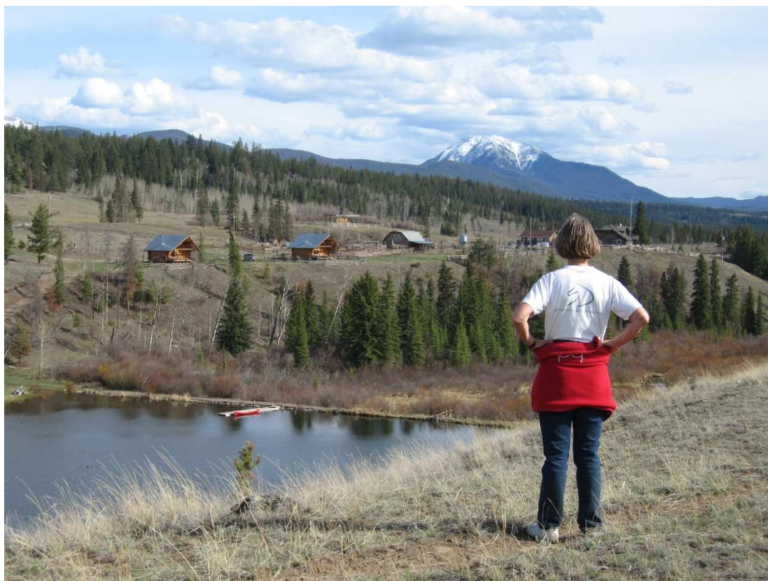
Udsigt over en del af ranchen. Græsset er endnu ikke blevet grønt og der er ingen blade på træerne.

Vi har nu været på Big Bar Guest Ranch et par uger.